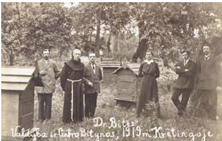
Pav. 2. „Bitės“ draugijos valdyba ir centrinis bitynas Kretingoje 1919 m.

Kretingoje veikė „Bitės“ draugijos vadovybė, centrinis bitynas, avilių dirbtuvės. Paskaičiuota, kad Kretingos ir Darbėnų apylinkėse tūkstančiui gyventojų tuo metu teko 50 bičių spiečių.